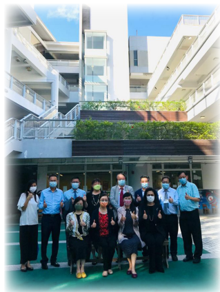
▲ 香港教育行政學會執委們於 2021 年 6 月 17 日參觀香港教育大學賽馬會小學

教大賽小在行政架構上，除特設行政組別專責統籌「德育、公民及國民教育」外，亦鼓勵教師積極進修，拓建「背靠祖國，面向世界」的視野及培育「家國情懷」。早於 2010 年，學校已推薦多位教師完成「國情與基本法研習班」、清華大學（香港教師）國情培訓計劃，並有教師獲推選為香港基本法推介聯席會議「中小學生基本法問答比賽」的評判之一。學校積極鼓勵中層同工出席香港教育界慶祝中華人民共和國成立的活動，每年本校均有同工代表出席。