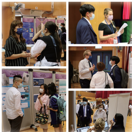
▲ 力求卓越、用心溝通

學校領導和管理是一項極具挑戰而讓人滿足的工作，而教育行政包含的任務甚為廣泛，其主要範圍有對學生、教師、員工、教學、財務、總務及社會合作關係等方面的協調、調動及推展。我在教育行政的旅途上，主張「力求卓越」、「致誠領導」及「服務社群」。