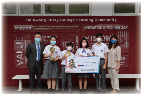
▲ 大光德萃書院同學獲獎

工作的時候，無論面對任何人，態度必須真誠。在學校這個龐大的家庭中，每一位成員都非常重要，值得珍惜，而建立互信則是團隊中不可或缺的元素。一個向心強的團隊，實在有賴於日常一點一滴慢慢地經營及培養，當中我特別注重溝通。在策略規劃及活動組織時，相關的同事們均會獲邀參與其中，就既定的目標主動發表意見，使最終的資訊和政策透明化 (transparent)，在積極鼓勵及致誠領導的情況下，形成良好的團隊文化。在和諧共融的環境裡協作同行，教育管理行政的工作果效更相得益彰。