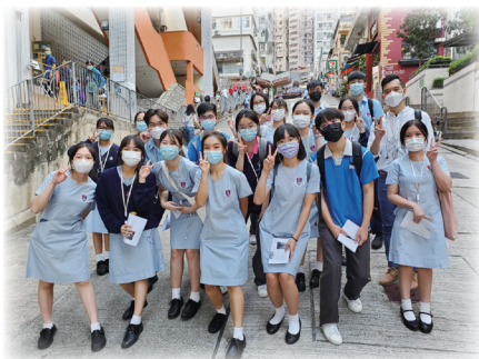
▲「文化旅遊在香港」專題研習，同學到港島遊學

初中生們以不同的小組形式，訂定研習專題，先以跨學科的閱讀材料、又以自主學習的形式在不同的平台搜集、整理及分析資料、再進行考察及探究、討論及提交報告、學生須在課堂滙報成果分享，優秀的專題研習小組會被挑選在初中週會向同學滙報。