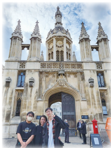
▲ 沙田循道衛理中學同學代表香港到英國參與參加模擬聯合國會議