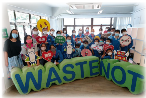
▲ 中二級專題研習參觀惜食堂的相片

本校在學校的教與學委員會、課程發展組及各科主任的帶領和協作之中，訂定了配合聯合國可持續發展目標和全球公民教育為學習目標，以跨學科的組合（例如 STEM 及電腦科；綜合科學、STEM 及數學科；英文、音樂及視藝科；中文、中史、電腦、英文及世界歷史科），為學生訂定了不同的專題研習（例如 STEM 智能家居、STEM 專